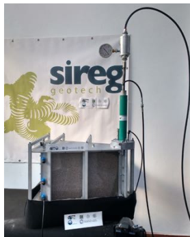
The ITS (Injection Tube System) in action!

The strong synergy between the multi-sector scientific expertise of the University of Milan Bicocca and professionals specialized in the design, construction and management of geomaterial treatment interventions will enable this new company to enter a niche market that is very interesting, with a perspective of revenues, turnover and profits already from the first months of life. The Research & Development activity will allow to obtain a high level of innovation in this very specialized sector.