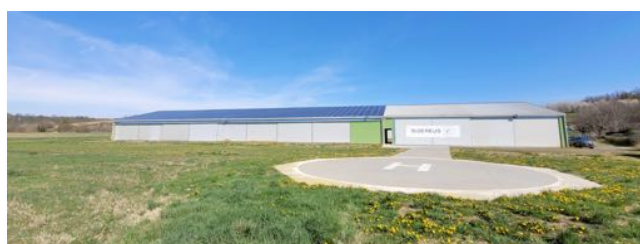
The headquarters of Sidereus and the first rocket engine test site a few km away from Turin.

In ottobre, anche la terza ed ultima area di sviluppo verrà avviata, ossia l'avionica di guida. Con i risultati molto incoraggianti già raggiunti e l'anticipo maturato è stato quindi deciso di procedere al primo lancio a poche centinaia di metri entro l'inizio del 2023, con un primo volo orbitale previsto per l'inizio del 2024.