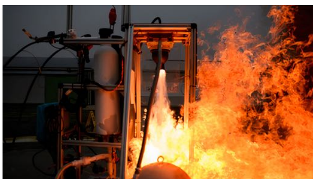
One of many rocket engine ignition tests

Not only propulsion, ahead of schedule experimentation on the structures was also started, making the first prototype of these.